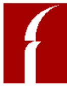
ILLUSTRAZIONE DEI CRITERI DI VALUTAZIONE

La valutazione delle voci è fatta secondo prudenza e nella prospettiva della continuazione dell'attività. Gli elementi eterogenei ricompresi nelle singole voci sono valutati separatamente.